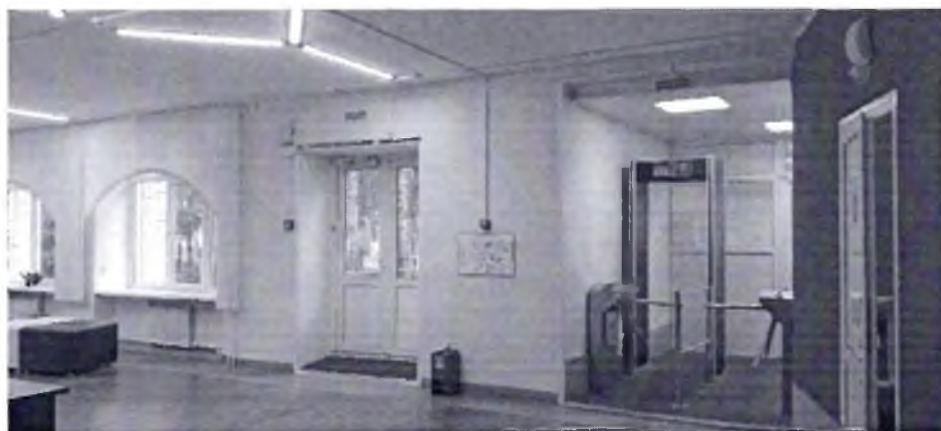
Фото № 12