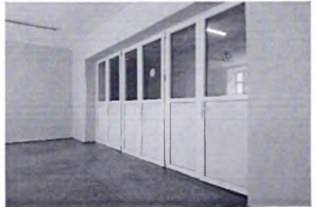
Φοτο № 26