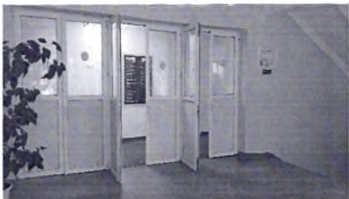
Фото № 15