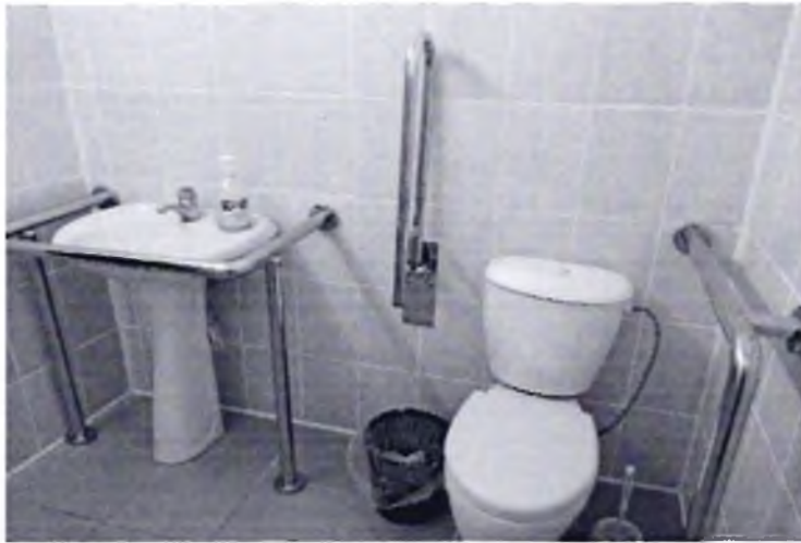
Фото № 35