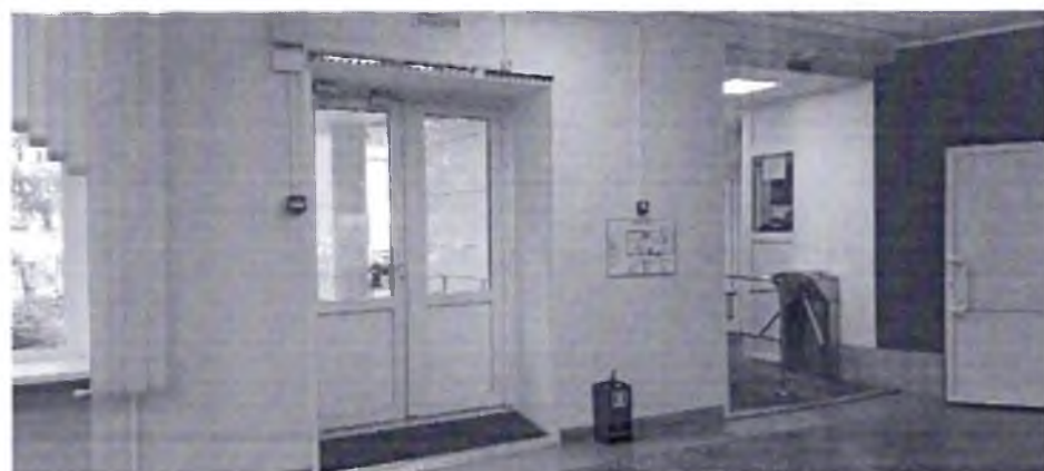
Фото № 14