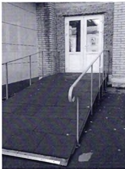
Φοτο Νο 9