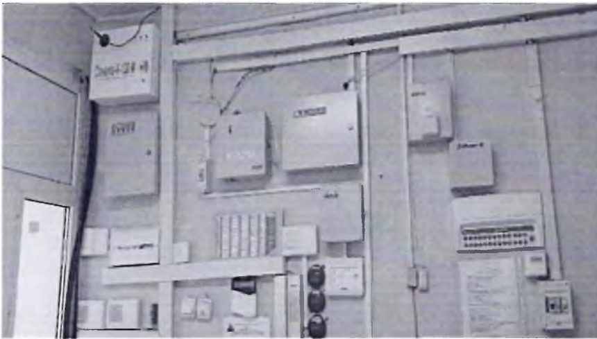
Фото № 42