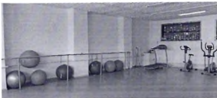
Фото № 33