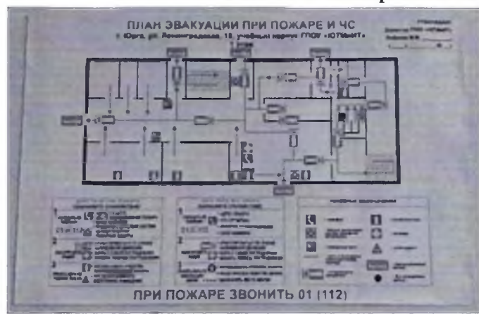
Фото № 44 (1 этаж)