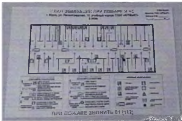
Фото № 45 (2 этаж)