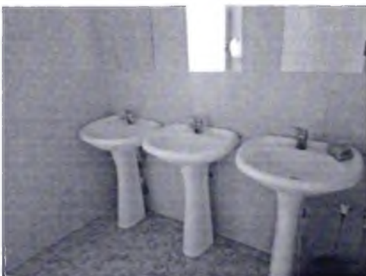
Фото № 39