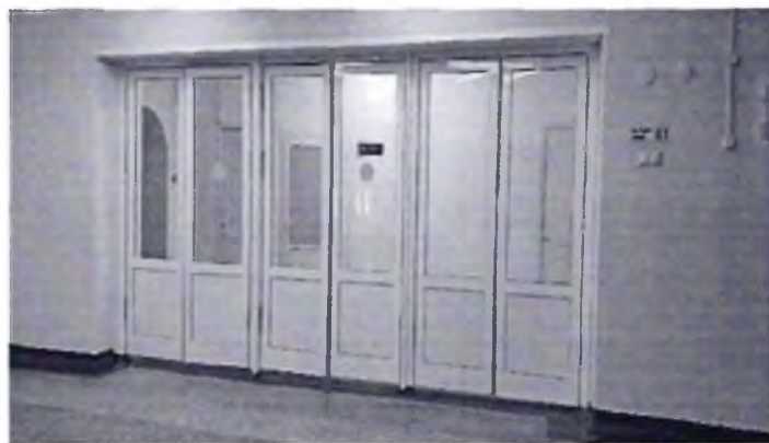
Фото № 16