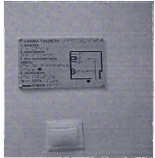
Фото № 36