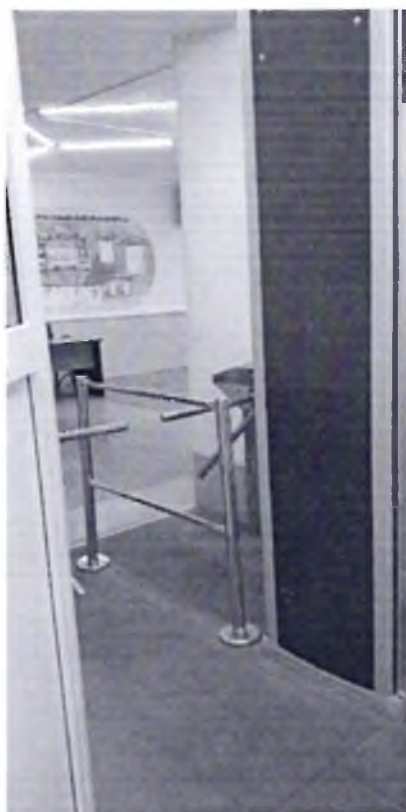
Фото № 13