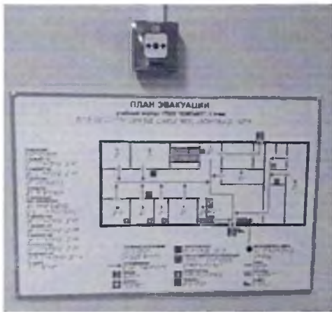
Фото № 43 План эвакуации