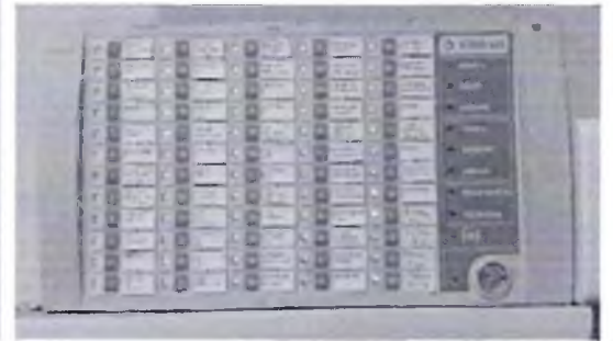
Фото № 44 Пожарная сигнализация