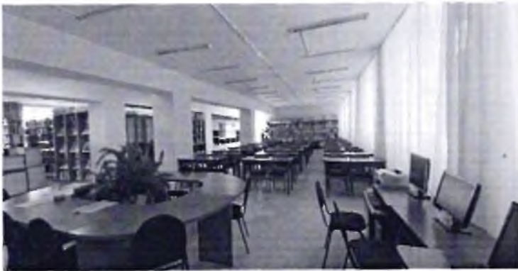
Фото № 29