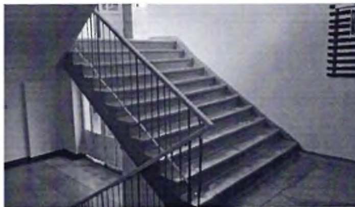
Фото № 20