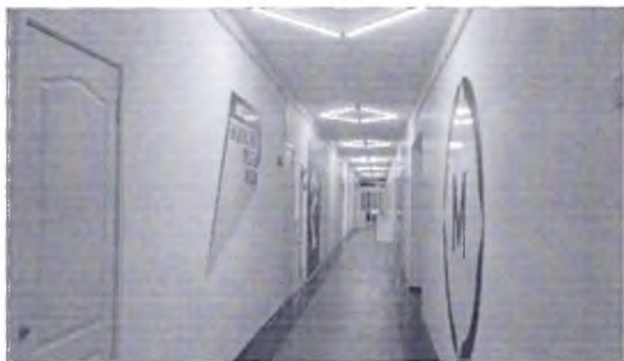
Фото № 17