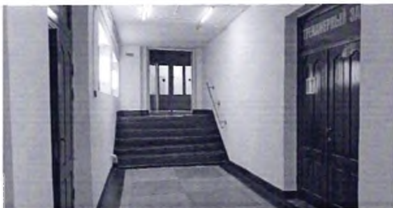
Φοτο № 25