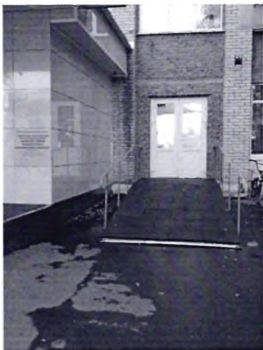
Φοτο Νο 8