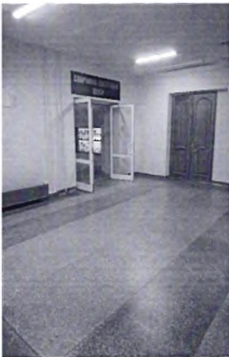
Φοτο № 23