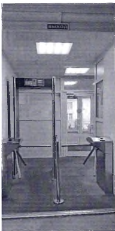
Фото № 11