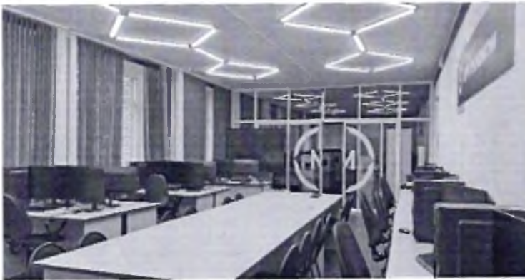
Фото № 31