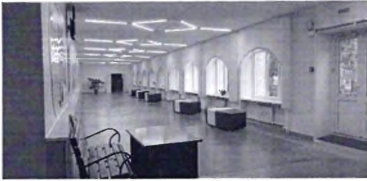
Фото № 27