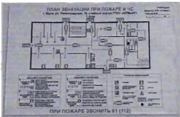
Фото № 47 (4 этаж)