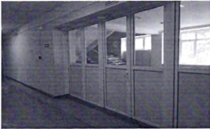
Φοτο № 21