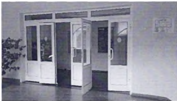
Фото № 18