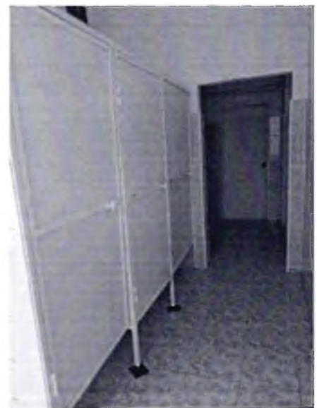
Фото № 41