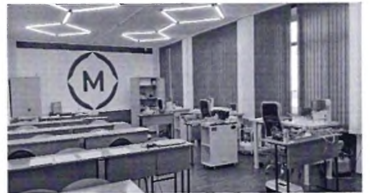
Фото № 32