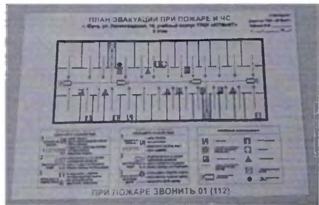
Фото № 46 (3 этаж)