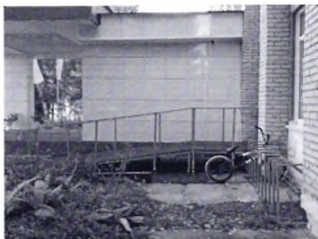
Φοτο Νο 10