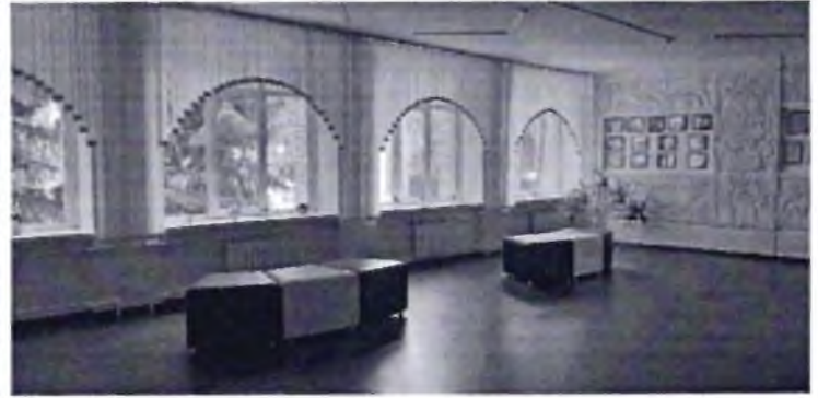
Фото № 28