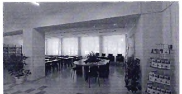
Фото № 30