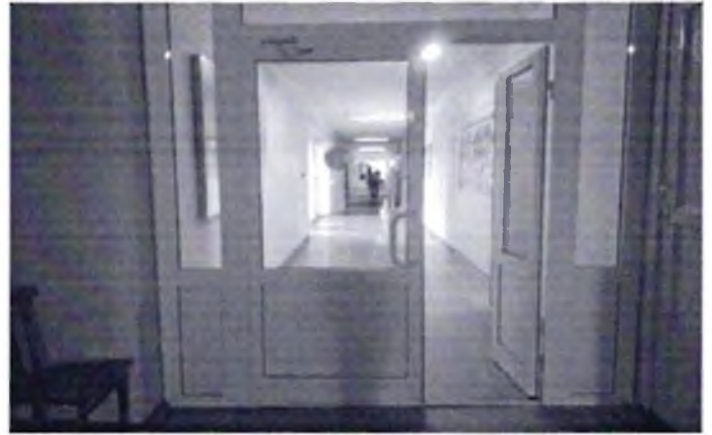
Φοτο № 22