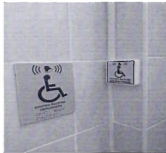
Фото № 38