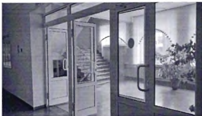
Фото № 19