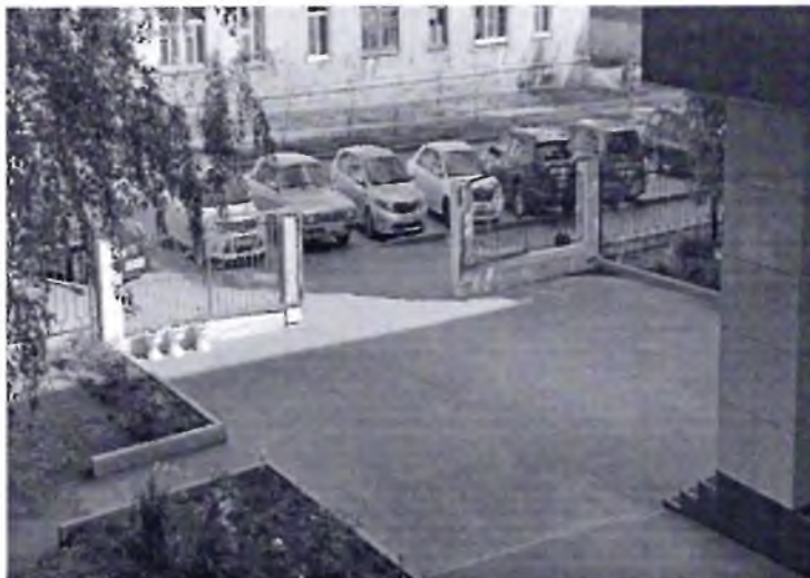
Φοτο Νο 7