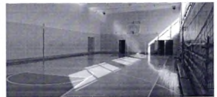
Фото № 34