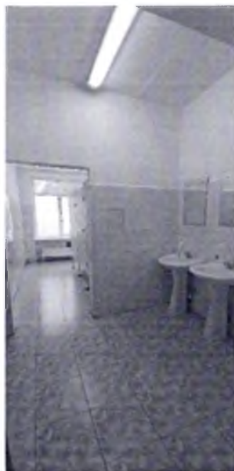
Фото № 40