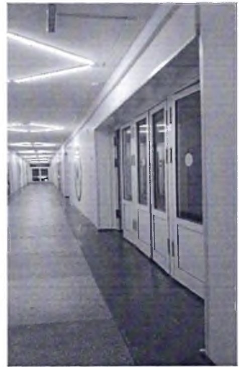
Φοτο № 24