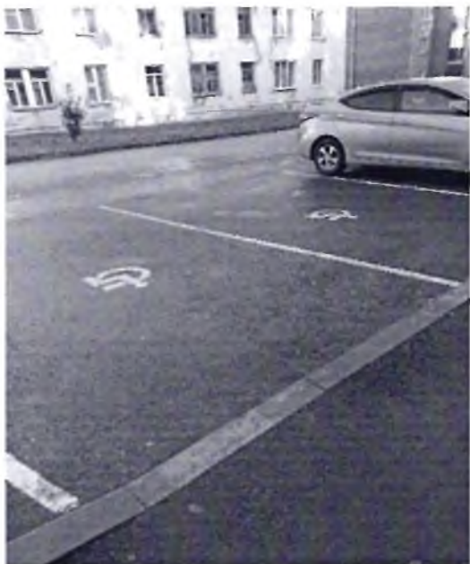
Φοτο Νο 6